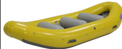
DESCENTE DE RIVIÈRE