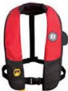
Veste de flottage